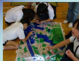
やめられない！とまらない！地域防災活動

T-DIGは、参加者が地図を囲み、書き込みを行いながら、楽しく議論することで、わがまちに起こりうる災害像をより具体的にイメージすることができる一つの手法です。さらに、このT-DIGを通して参加者どうしの距離が近づき、まちづくりをする上での重要な人と人との関係も育まれます。でも、T-DIGは1回行えばよいというものではありません。最初のステップとしては、基本的なマップづくりから初め、地域の課題を徐々に見つけて、より具体的な災害対応へと話を深めていき、指揮所訓練、発災型防災訓練へと発展させていくことができます。 [瀧本浩一]